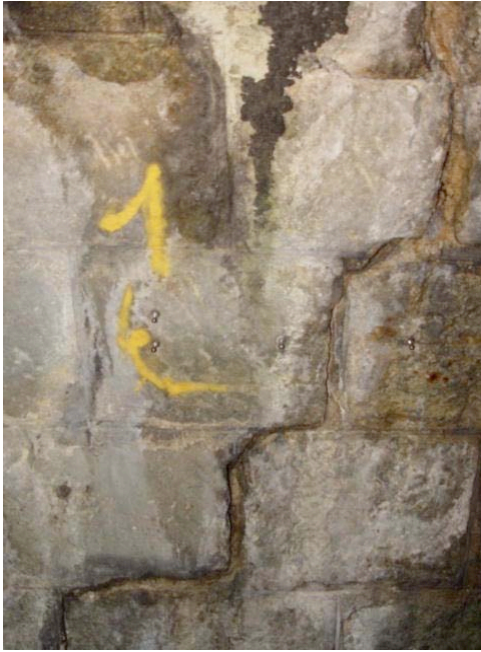
Tunnel de Poggio

Fissure transversale millimétrique instrumentée