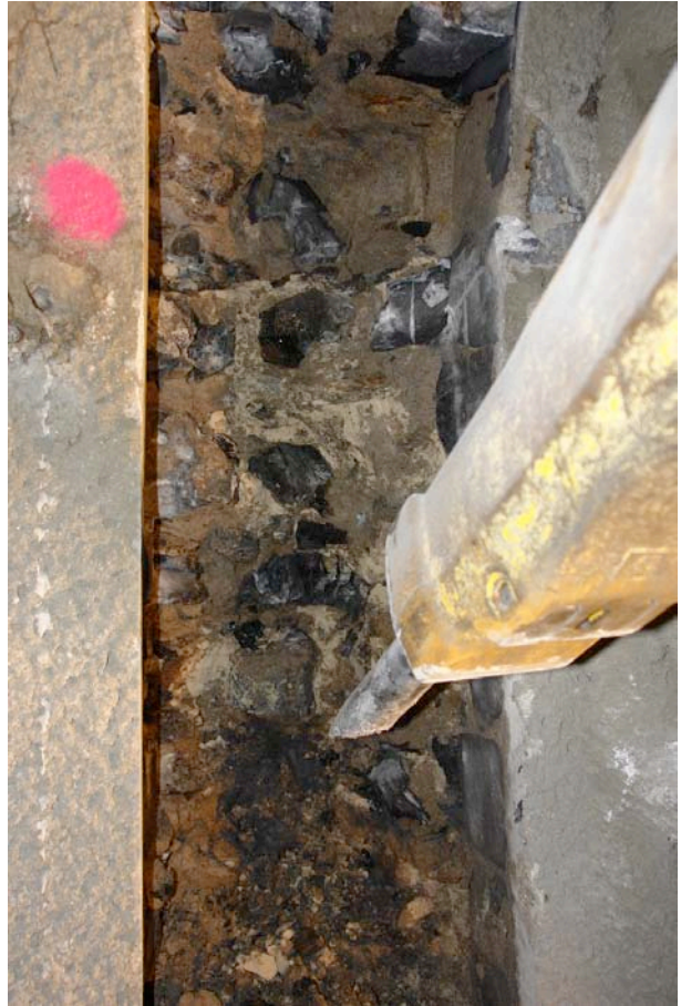
Tunnel de Ponte Rotto - Réalisation de nervures à l'intérieur du parement en maçonnerie