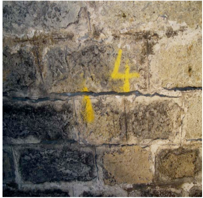
Tunnel de Poggio

Fissure transversale millimétrique instrumentée