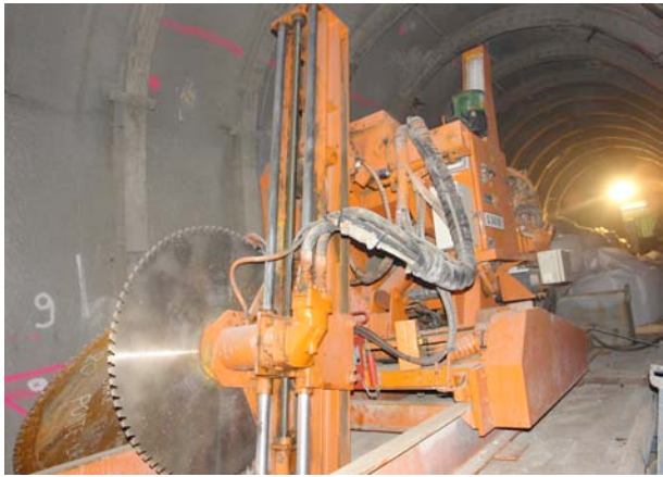
Tunnel de Ponte Rotto - béton projeté - Matériel de pré-découpage de la maçonnerie