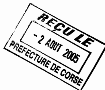
Camille de ROCCA SERRA